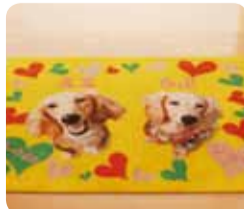
玄関を開けるとすぐに目に飛び込んでくる愛らしいマット。ペットへの愛が伝わってきます。

サニクリーンのマットやモップが、私たちと犬たちの心地よい環境をラクにかなえてくれるんです。