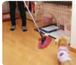
愛犬との生活に大活躍の「ネオシャルティ」でお掃除もラクラク。モップは奥様の力強い味方です。