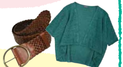
丸バックル太メッシュベルト ¥9,450 A キルトピン付ボレロカーディガン（グリーン） ¥11,550 A