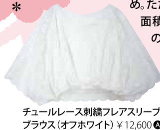
チュールレース刺繍フレアスリーブブラウス（オフホワイト） ¥12,600 A

A. 袖は少し長めで、腕にフィットしすぎないものをおすすめ。ただし透け感や素材の軽やかさがなくて「ただ面積が大きい腕」になるので気をつけて。「洋服の中で身体が泳ぐ感じ」が着やせの鉄則です。