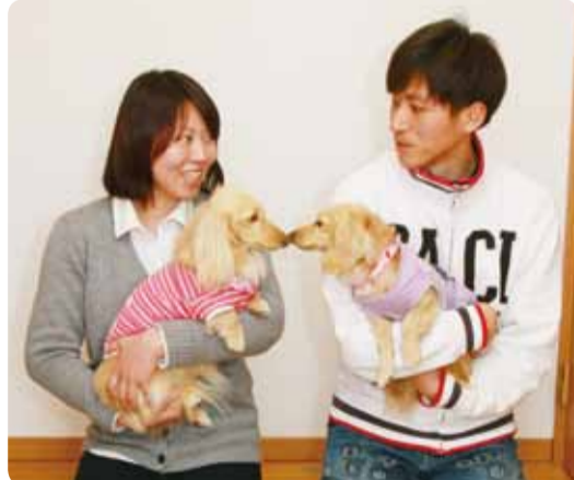
「人間2人と犬2匹の生活です」と笑顔で語られる奥様。旦那様と一緒に、ペットのらぶちゃん、ミミちゃんをだっこ。