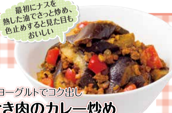
最初にナスを熱した油でさっと炒め、色止めすると見た目もおいしい

まとめて下ごしらえしたり加熱調理しておくことで節約・時短になる晩ご飯やお弁当のおかずを紹介します。