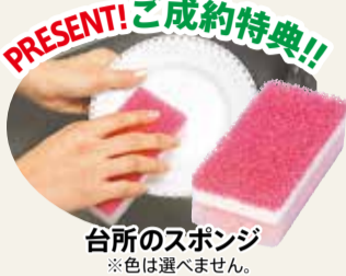
台所のスポンジ ※色は選べません。