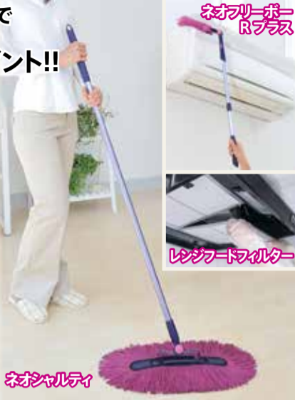
ネオフリーポ Rブラシ