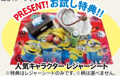
人気キャラクター レジャーシート ※特典はレジャーシートのみです。※柄は選べません。