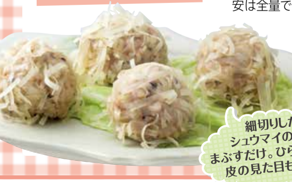
細切にしたシューマイの皮をまぶすだけ。ひらひらした皮の見た目も楽しい

つくりおきポイント 加熱し水気を切った玉ねぎを使って保存性アップ。冷凍の場合は火を通した後に保存。 保存の目安 冷蔵: 3~4日 冷凍: 3週間