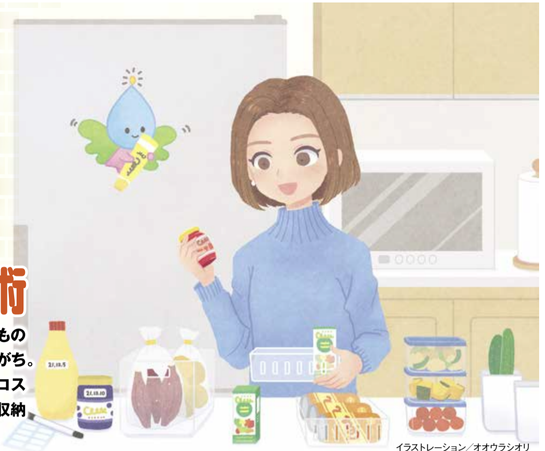
イラストレーション/オオウラシオリ

気づくと冷蔵庫内が食材であふれている、賞味期限切れのものが発見されるなど、冷蔵庫内の整理整頓は案外、後回しにしがち。冷蔵庫内を整理すると使いやすくなるうえ、節電や食品ロス削減効果も。そこで今回は冷蔵庫内の整理方法や便利な収納アイデアをご紹介します。